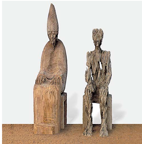
Andreas Kuhnlein: „Schein und Sein – Stellvertreter“, mit der Kettensäge aus Ulme und Eiche gearbeitet.