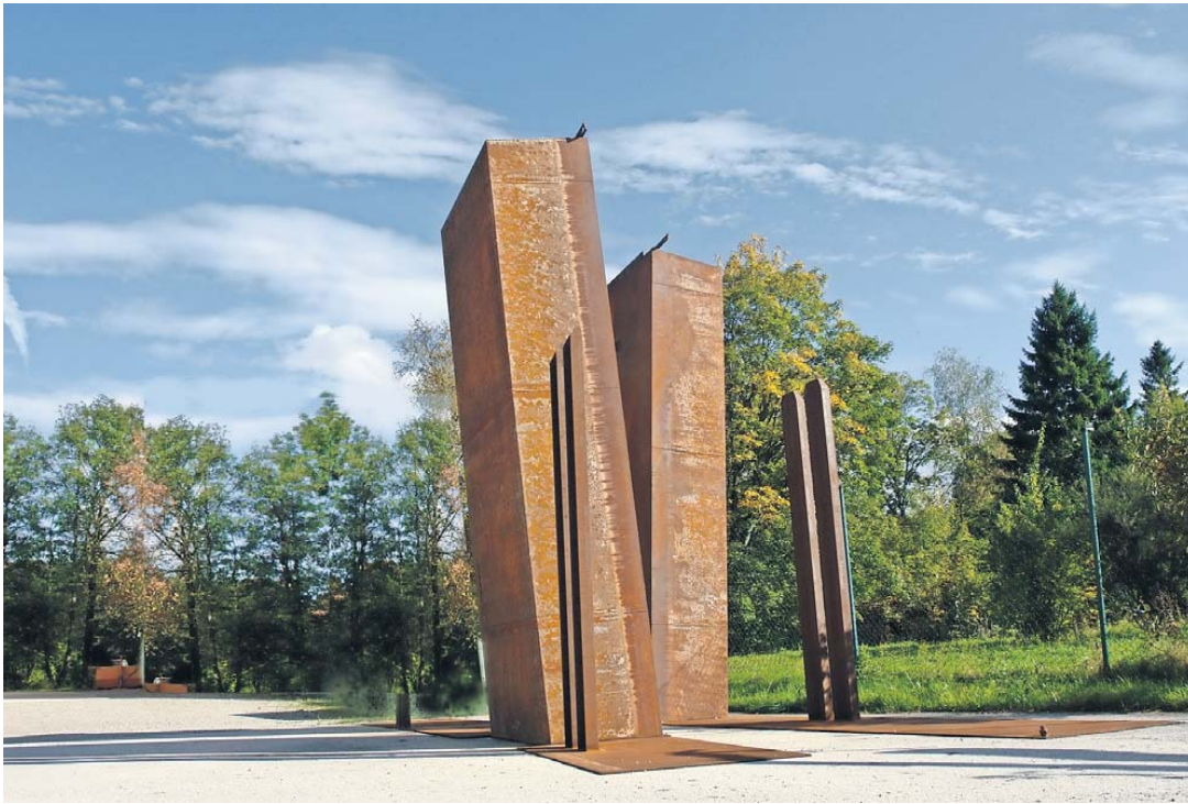
„Aus dem Lot“: Erwin Wieglerling (e.lin) bringt diese Stahlskulptur nach Lenggries. Die beiden mehr als sieben Meter hohen Objekte sind nicht parallel angeordnet; sie wirken schwankend, im Ungleichgewicht.